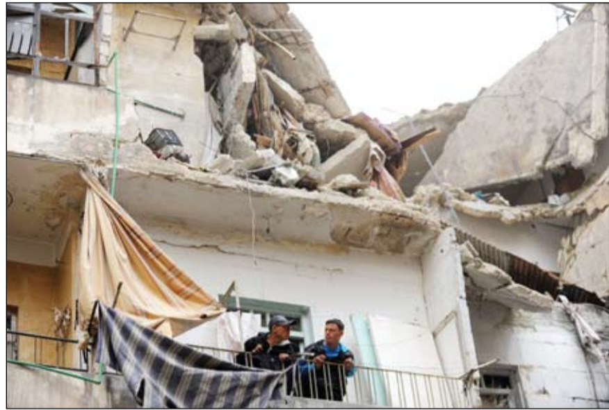
سكان يطولون من شرفة منزل دمر في قصف للنظام على مدينة حلب

يعد أمنا لسيارات النظام التي يتم استهدافها باستمرار من قبل الثوار، حيث لم يبق أمام النظام سوى طريق الطائرات المدنية لنقل الحمولات العسكرية عبره. وفي جنيف تبنى مجلس حقوق الإنسان في الامارات والسعودية وتونس دورته الثانية والعشرين المنعقدة في جنيف بأغلبية اصوات 41 دولة مقابل اعتراض دولة واحدة وامتناع 5 دول عن التصويت ومشروع القرار الذي قدمته كل من المغرب وقطر والاردن والامارات والسعودية وتونس