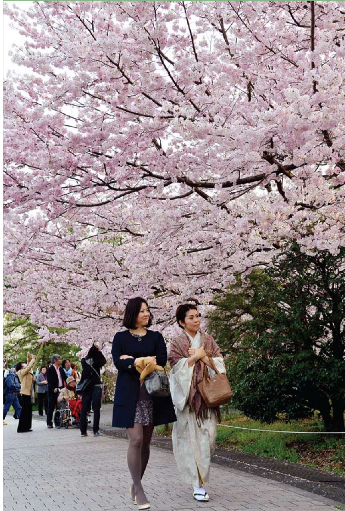
سياح وسكان محليون يسبرون في أحد شوارع طوكيو تظلهم أشجار الكرز التي تميز اليابان وتحتفل في موسمها حالياً.