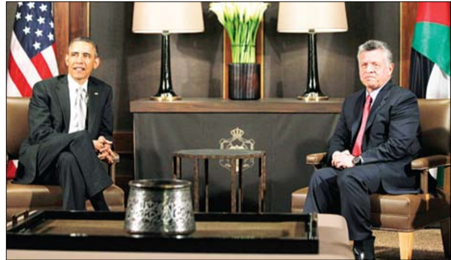
عاهل الاردن خلال استقباله الرئيس الامريكى

وصل الرئيس الأميركي باراك اوباما مساء الجمعة الى الأردن المحطة الأخيرة في جولته في الشرق الاوسط، والتقى عاهل الأردن الملك عبد الله. وحطت الطائرة الرئاسية الأمريكية في مطار الملكة علياء (35 جنوب عمان) الساعة 17:45 بالتوقيت المحلي (14:45 تغ) حيث اصطف حرس الشرف لاستقبال الرئيس الأميركي الذي كان في استقباله وزير الخارجية الاردني ناصر جودة وعدد من المسؤولين. وقال مصدر رسمي أردني أن أوباما سيجري خلال زيارته التي تستغرق يومين ، مباحثات مع الملك عبد الله الثاني تتناول في المقام الأول الأوضاع المتصاعدة في سوريا ، إضافة إلى الملف الإيراني والفلسطيني وعدد من القضايا الإقليمية والعلاقات بين البلدين. واختتم الرئيس الأميركي بإرام أوباما، امس الجمعة، زيارته للأراضي الفلسطينية بزيارة تكتيكية الهد رافقه خلالها وزير