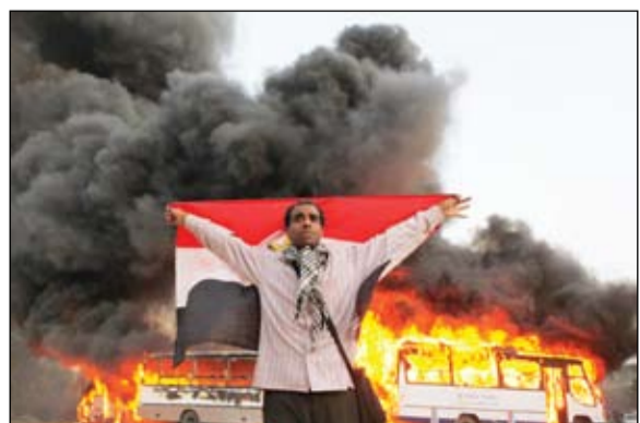
المتجولون احرقوا باصات نقلت مؤيدي الإخوان من المحافظات الى القاهرة

لجماعة الإخوان المسلمين بالحى، موضعاً أنه جرى تحطيم محتويات المقر وبعثرتها. وأضاف الشاهد أن قوة من عناصر الأمن المركزي وصلت إلى المقر بعدما تم تحطيمه، وقامت بفرض طوق أمنى للحفاظ على الأوراق